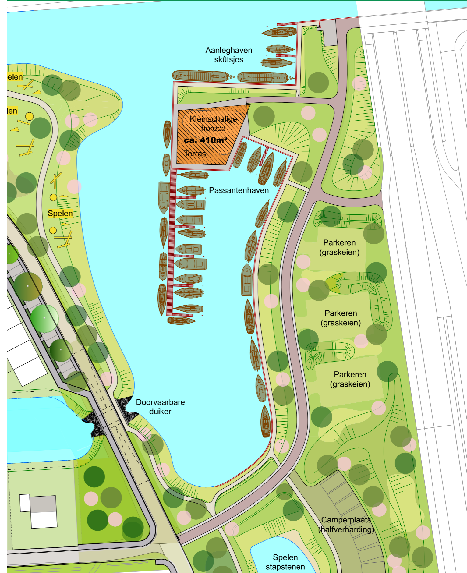
Voorlopig Ontwerp Parkhaven (bijlage 1)