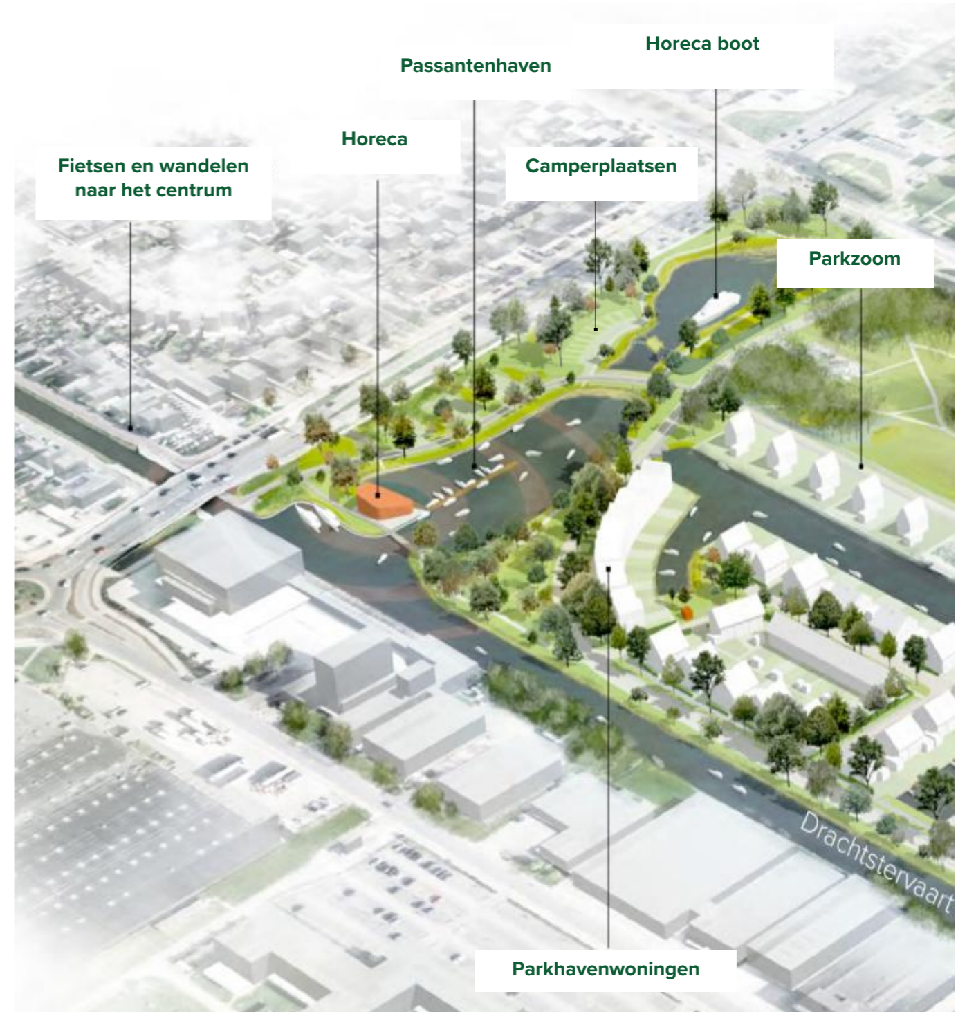
Indicatieve verbeelding Parkhaven.